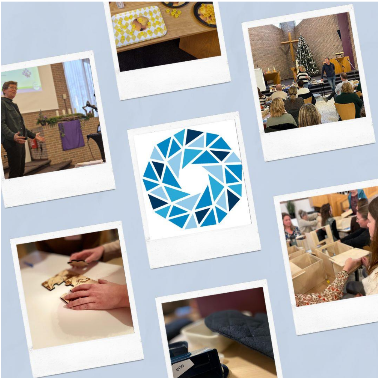
Bijeenkomst Autisme Belevingscircuit op 12 december 2024