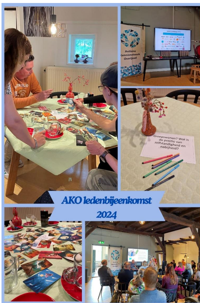
AKO ledenbijeenkomst 2024

Ledenbijeenkomst 'Wonen met begeleiding' op 24 september 2024